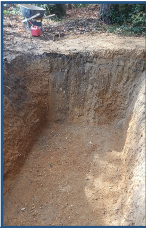
Foto de la zona excavada