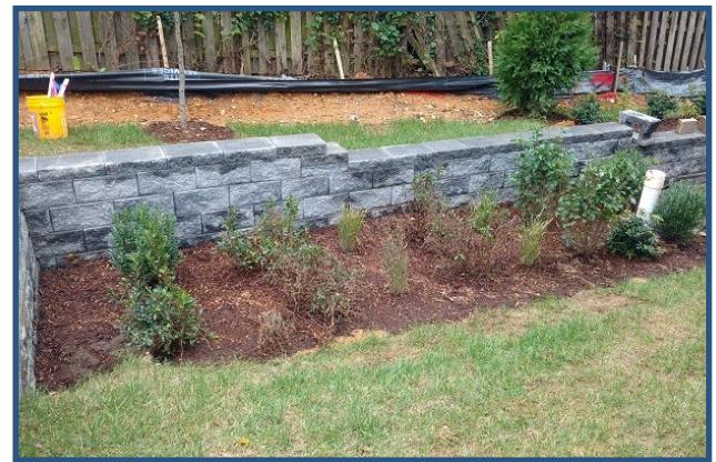
Foto de la instalación terminada mostrando todas las plantas instaladas