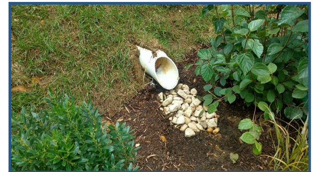
Fotos de todos los flujos de entrada a la instalación (tubería, canalización, flujo de láminas, etc.)