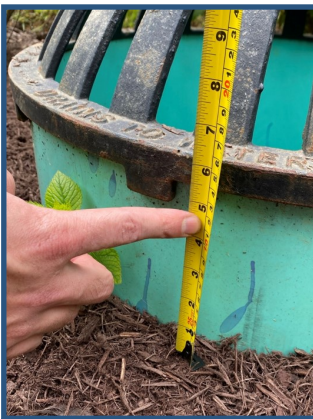
Fotos claras de la profundidad del estanque y del borde libre