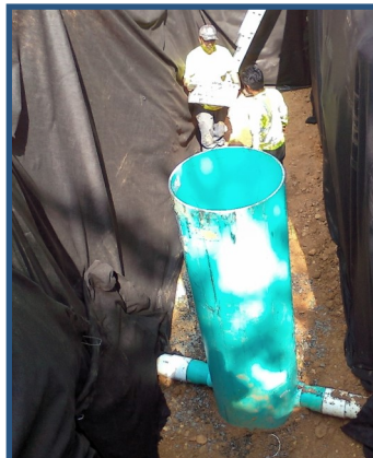
Tubo de desagüe y drenaje inferior perforado