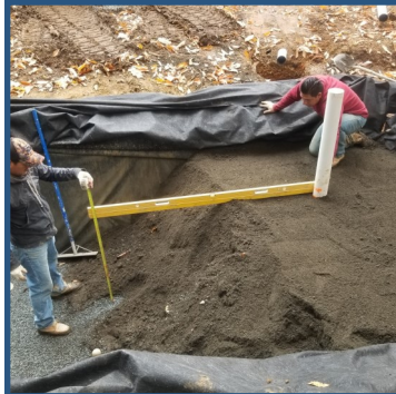
Foto clara de la profundidad del suelo