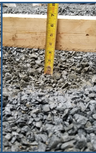
Foto clara de la profundidad de la grava de estrangulamiento