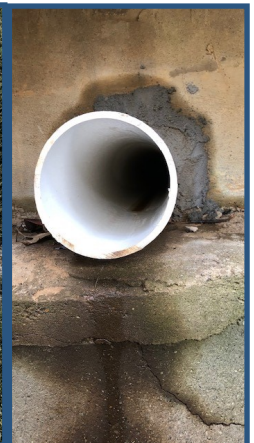
Foto de la ubicación de la descarga del drenaje inferior