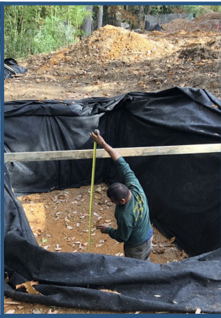
Foto de la profundidad total