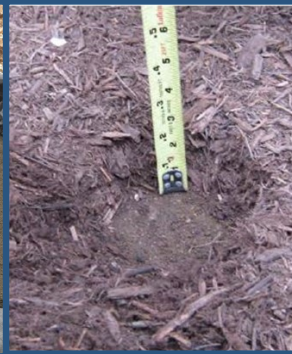
Foto clara de la profundidad del mantillo