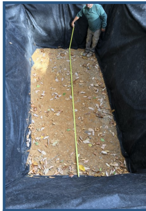
Foto de la longitud y el ancho total