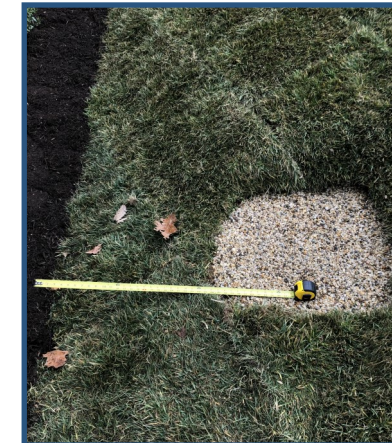
Foto de todas las medidas de pre-tratamiento requeridas